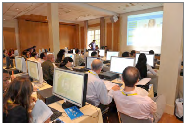
La salle de classe