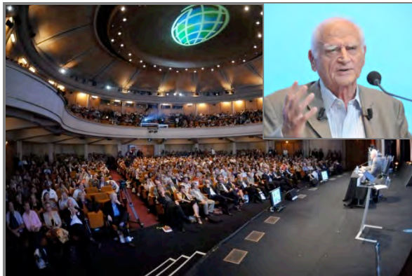
Témoignage de Michel Serres