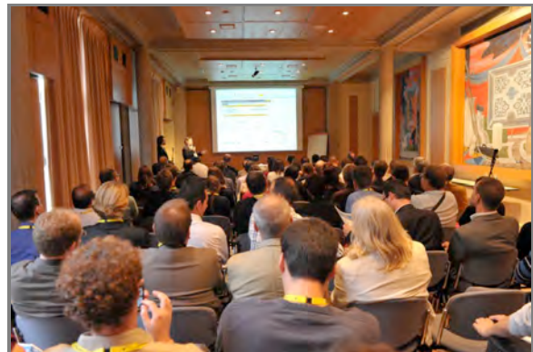
200 Communications utilisateurs