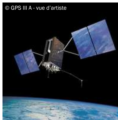
© GPS III A - vue d'artiste

La NOAA a quant à elle été financée à hauteur de 4,9 milliards de dollars (soit 583 millions en dessous de la requête de la Maison Blanche).