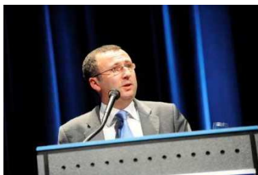
© Idate - Christophe Allemand, CNES, intervenant au DigiWorld Summit

Le secteur des satcoms devrait amplifier sa présence en 2012 lors du prochain DigiWorld Summit. www.digiworldsummit.com