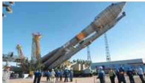
Soyouz-2.1 avec six satellites de télécommunications américains Globalstar-2

Globalstar, installé en Californie, fournit des services de communication vocale et de données aux entreprises, agences gouvernementales et aux particuliers. Les satellites ont été développés par la société