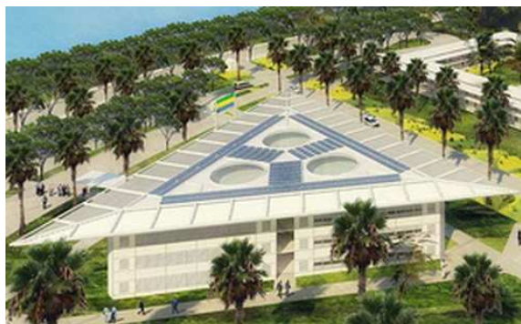
© Représentation architecturale du centre de télédétection Cabinet d'architecture Atelier Nebout.