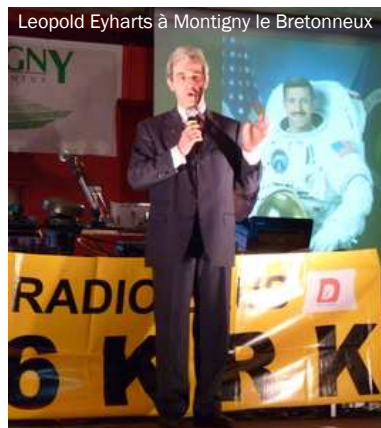
Leopold Eyharts à Montigny le Bretonneux